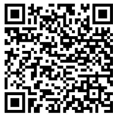
公司招聘官网及简历投递渠道